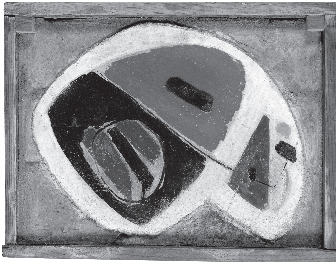
Sense títol, c. 1951-1952 | Tècnica mixta | 26 x 47,5 cm | Col·lecció família Guerrero

conjunt ara per primera vegada. Fruit d'aquell intens (re)trobament, Guerrero va pintar La brecha de Viznar (1966) i altres teles monumentals d'evocacions lorquianes. Guerrero va tenir sempre clara la importància de La brecha de Viznar dins la seva trajectòria: «Crec que va obrir una finestra nova [...]. Sempre m'ha fascinat el fet d'obrir una finestra, obrir un camí, obrir una escaleta.» Les ensenyances que Guerrero va treure d'aquest treball, a la vegada escenari d'un intens psicodrama i laboratori experimental, donarien peu a una nova etapa de la seva obra. Un moment molt interessant en què la destresa adquirida en el maneig del gest i els grans plans, la sensibilitat envers els cantells vibrants de les masses i les transparències, i en definitiva la maduresa de la seva dicció van ser posades al servei d'un nou repertori iconogràfic per donar compte de la seva pròpia memòria.